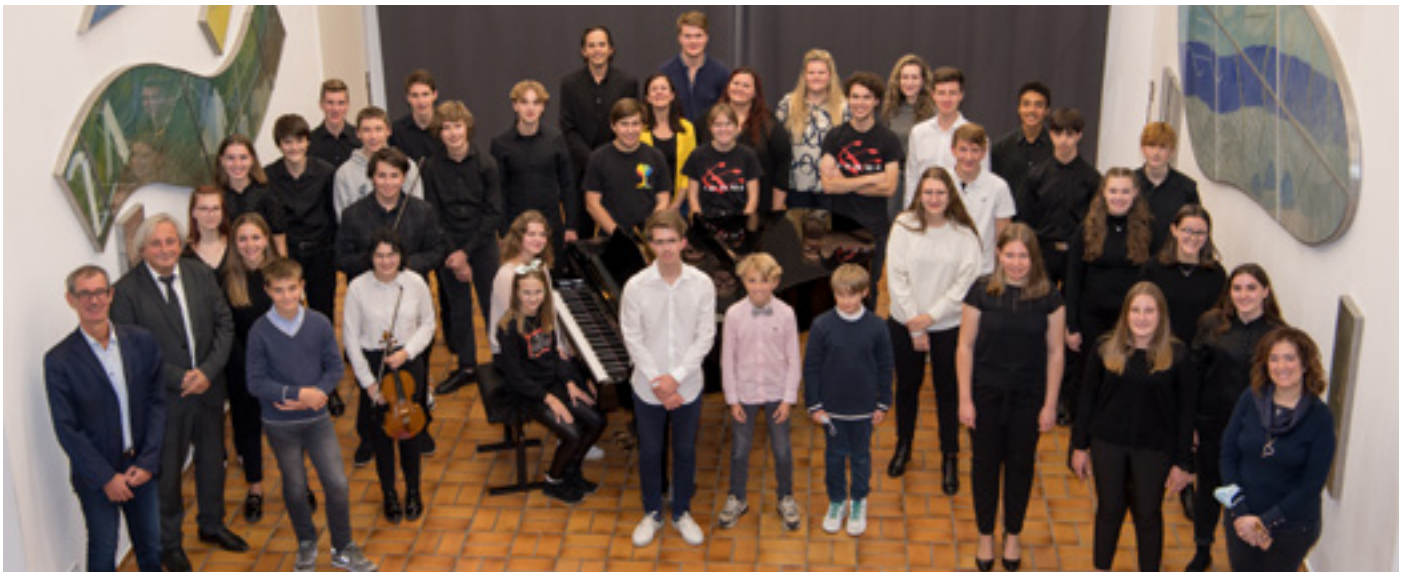
Srečanje glasbenih šol v Bilčovsu

Letošnji jubilejni Primorski dnevi so se začeli s predstavitvijo publikacij v torek, 19. oktobra, v Tischlerjevi dvorani. Goste iz Trsta in Gorice smo popoldne slišali še po radijskih valovih Slovenskega oddelka ORF. Nato so nadaljevali pot v Sele, kjer so spoznali bogato kulturno udejstvovanje tamkajšnjih društev ter se podali po sledih skavtskih taborjenj iz 60-ih in 70-ih let prejšnjega stoletja.